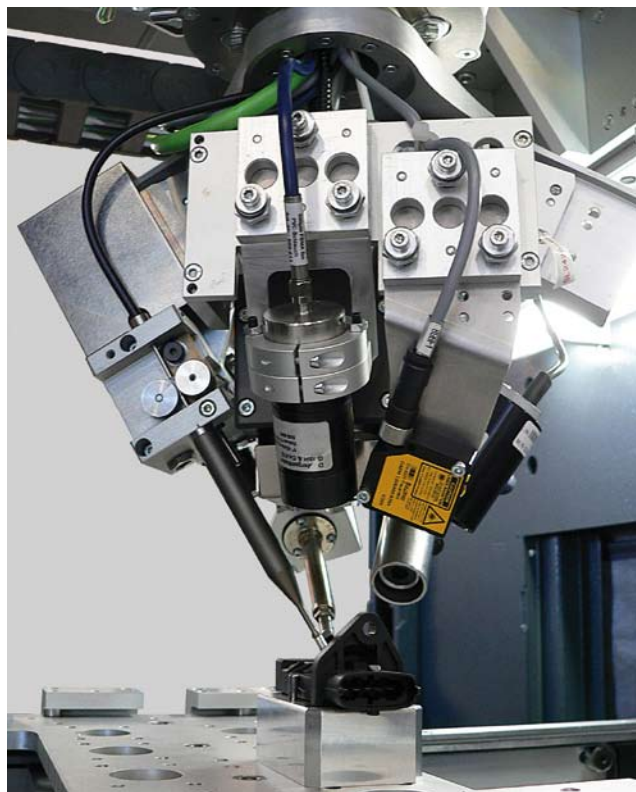
Testa di saldatura Laser del sistema Neosold

C on l'arrivo del Led nel Lighting, l'elettronica ha fornito uno strumento affidabile nel tempo e capace di assicurare un basso consumo energetico. Tuttavia i Led di potenza presenti sul mercato richiedono diverse attenzioni durante l'attività di assemblaggio. Il montaggio, la saldatura e i test risultano infatti strategici per assicurare le migliori performance.