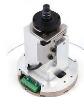
Presca a vuoto